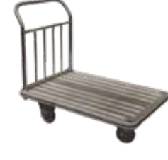
一部の人は台車の事を「ダンディ」と呼んでいたことも。

1965年に発売した弊社独自のダンディが日本で初めての規格産業用台車です。それ以来は半作で採用されています。日本のJS規格は今も昔もダンディが基準です。