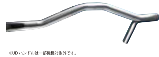
※UDハンドルは一部機種対応です。安い台車はハンドルが壊れやすく割れたり折れたりしていませんか？

ダンディ台車のハンドルへのこだわりは「楽取握り」形状に表れています。表面硬度は長く使っても劣化せず、強度の高いエポキシ樹脂を使用。取握りに関しては人間工学を用いて研究開発したUDハンドルを採用したため、握れにくく、コントロールしやすい形状にもなりました。