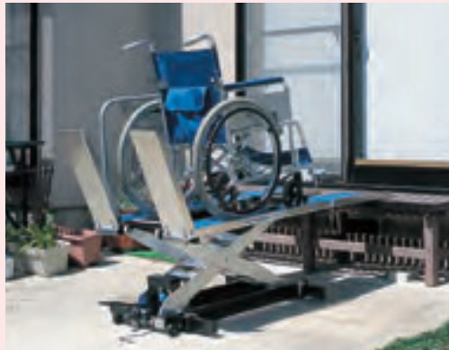
ZHW-150 一部オプションを使用しています(手すり)