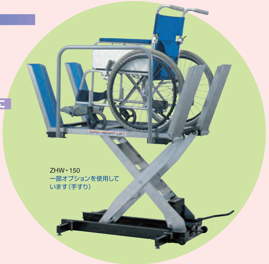
ZHW-150 一部オプションを使用しています(手すり)