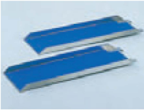
●延長ブリッジ 寸法/幅174×長さ1,200(mm)